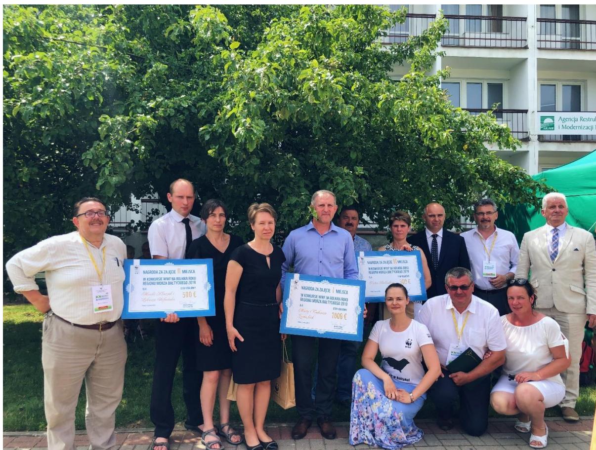
Rozstrzygnięcie konkursu WWF na Rolnika Roku regionu Morza Bałtyckiego 2019 podczas XX Mazowieckich Dni Rolnictwa