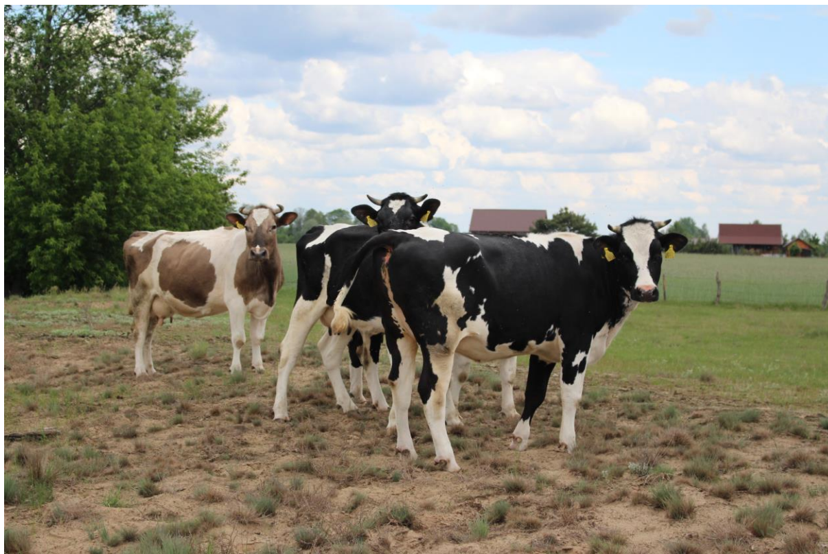
Wypas bydła mlecznego na pastwisku państwa Żerańskich